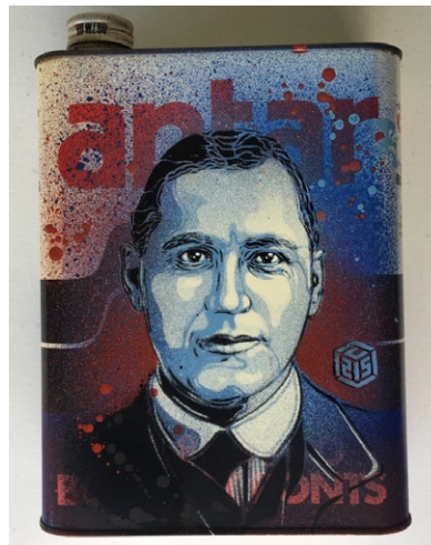
Portrait sur bidon de Walter Chrysler © C215