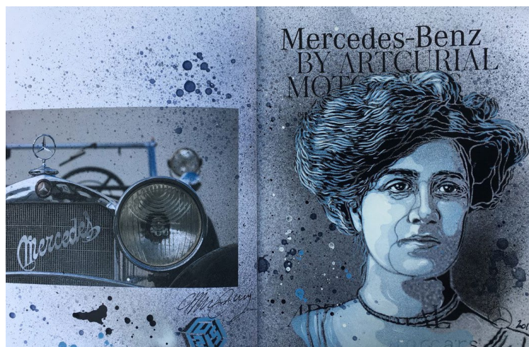
Portrait de Mercedes Jellinek par C215. Fille de l'homme d'affaires autrichien Emil Jellinek, née à Vienne en 1889, elle est à l'origine du nom de la marque éponyme. © C215

Exécutés sur des objets aussi populaires qu'insolites, comme d'anciennes pompes à essence américaines, et autant de bidons d'huile, de portes de 2CV, de bornes kilométriques, d'anciens parcmètres, des voitures jouet, ces visages ont bouleversé à jamais notre rapport au transport, à l'économie, au temps, aux distances, à la liberté, au travail, aux loisirs, à la culture, à la séduction et au luxe... et plus simplement notre rapport au monde.