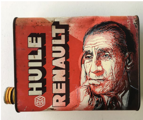
Portrait sur bidon de Louis Renault © C215